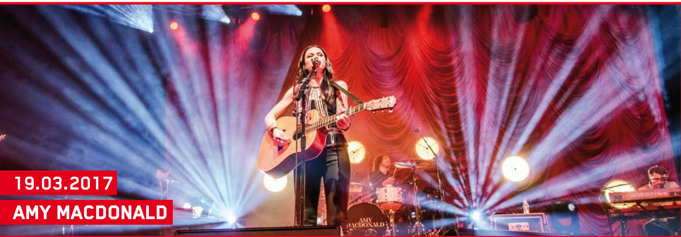
19.03.2017 AMY MACDONALD