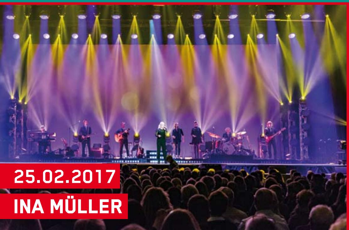
25.02.2017 INA MÜLLER