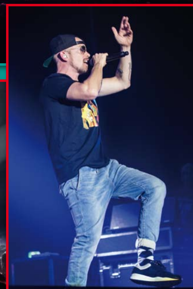
04.05.2017 DJ BOBO