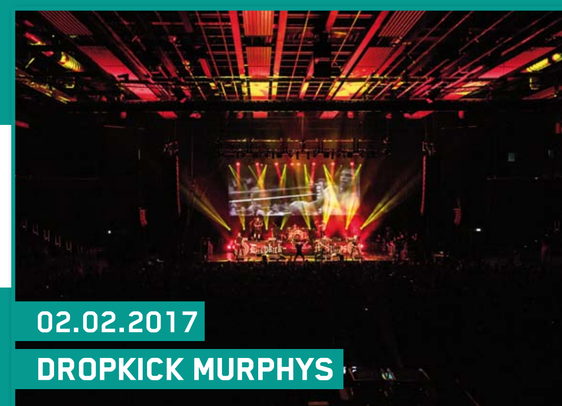
02.02.2017 DROPKICK MURPHYS