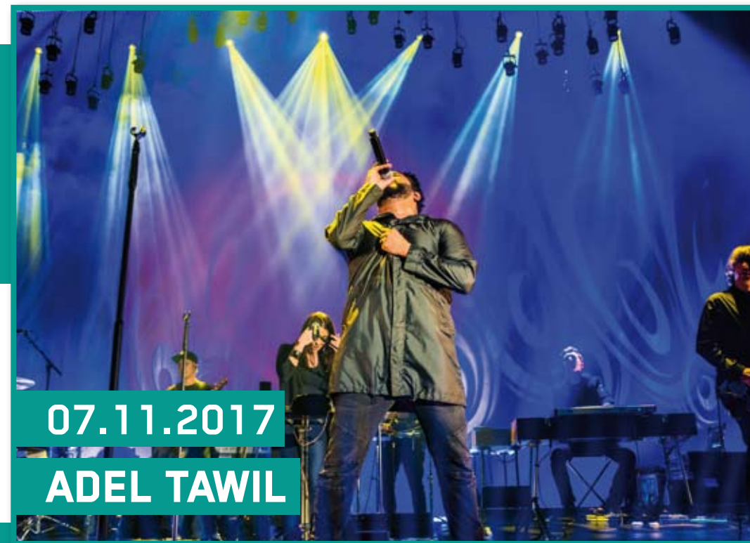
07.11.2017 ADEL TAWIL