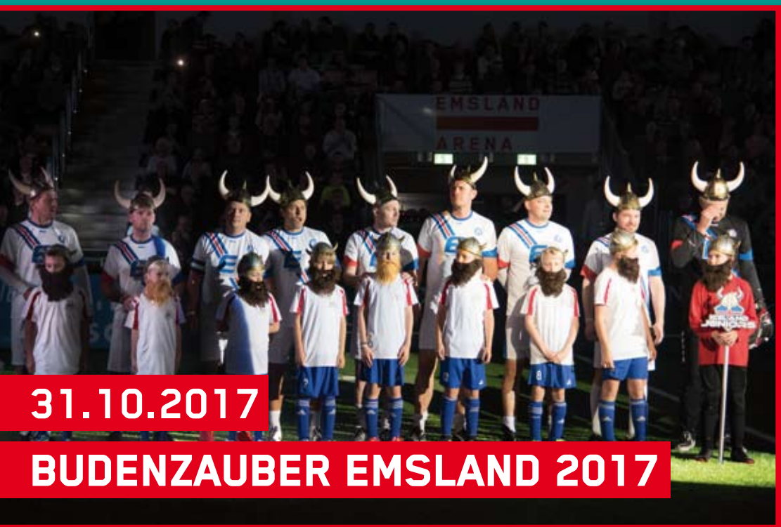
31.10.2017 BUDENZAUBER EMSLAND 2017