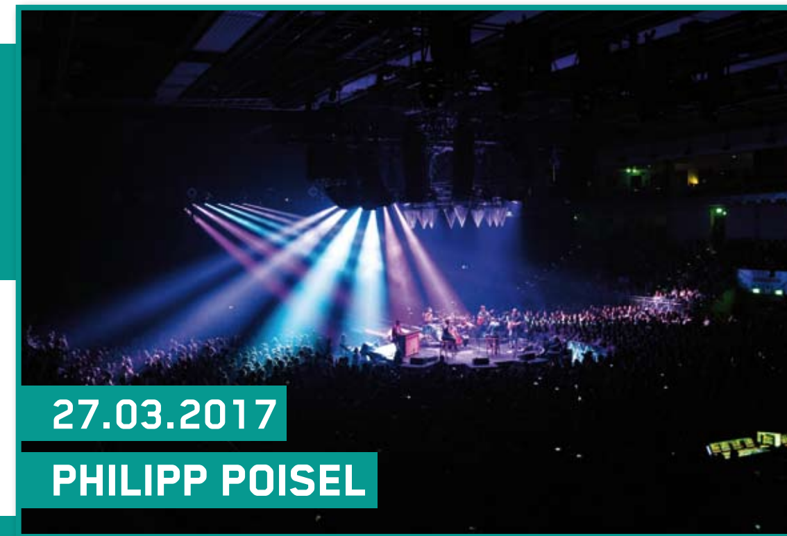
27.03.2017 PHILIPP POISEL