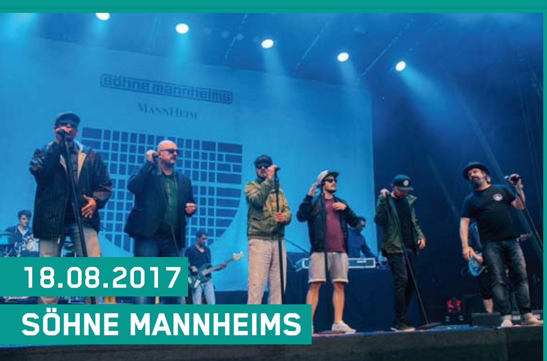
18.08.2017 SÖHNE MANNHEIMS