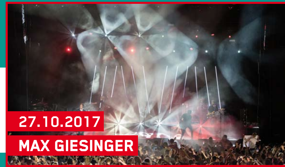
27.10.2017 MAX GIESINGER